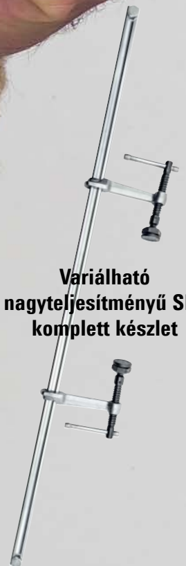
Variálható nagyteljesítményű SLV komplett készlet